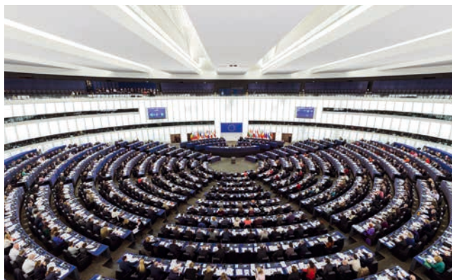
Der halbkreisförmige Plenarsaal des Europäischen Parlaments in Straßburg während einer Plenarsitzung.

Bitte beachten Sie: Ausgefüllte Briefwahlunterlagen können nur berücksichtigt werden, wenn diese bis spätestens 18.00 Uhr am Wahlsonntag bei der Stadt Dachau eingegangen sind. Verspätet abgegebene Stimmen dürfen nicht gezählt werden. ■