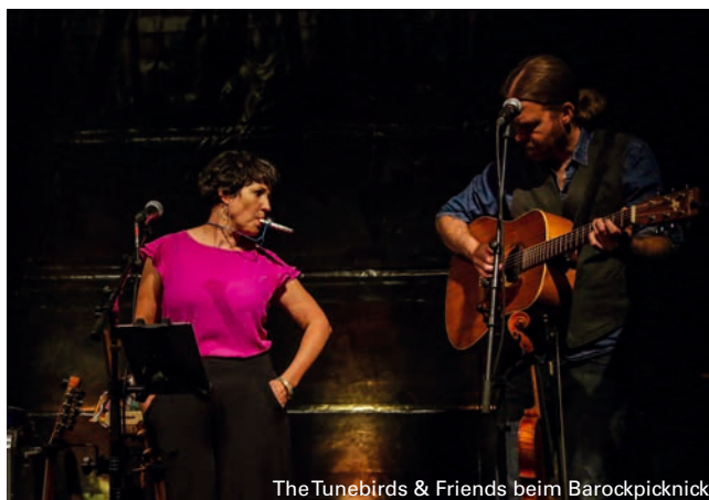
The Tunebirds & Friends beim Barockpicknick

Das Barockpicknick findet 2024 nur einmal statt, und zwar am Samstag, 20. Juli . Dafür wird das Ticketkontingent auf 1.500 Karten erhöht. Musikalisch gestaltet wird das Barockpicknick von The Tunebirds & Friends (Folk, Pop, Swing). Tickets sind für 10 € erhältlich. ■