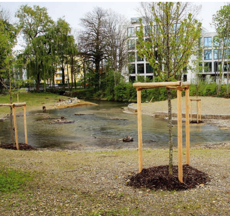
Südlich der Schleißheimer Straße wurde die Würm renaturiert.