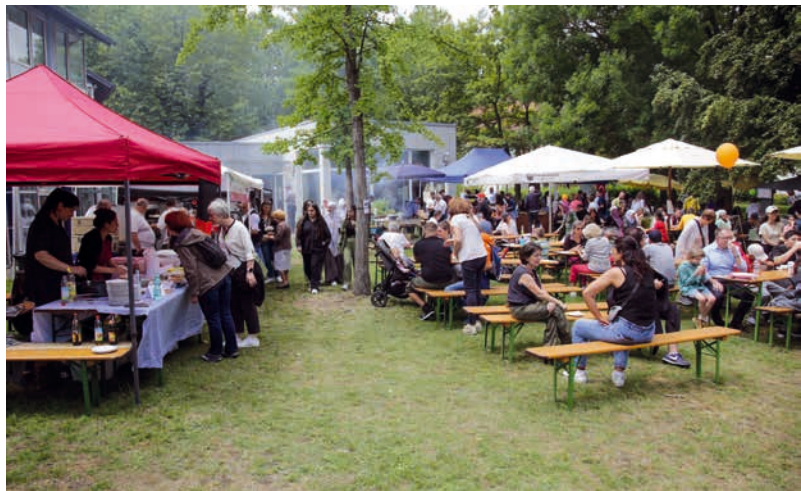
Auch kulinarisch kommt beim Familienfest niemand zu kurz.

Es ist ein kleines Jubiläum: Das Interkulturelle Familienfest findet heuer zum zehnten Mal statt. Mit von der Partie sind wie gewohnt verschiedene Gruppen, Initiativen und Vereine, z. B. die A Capella Company, Klangextrakt, die Knabenkapelle und Ropian (Irish Folk). Dazu wird an zahlreichen Ständen gebastelt, geratscht, geschminkt, gespielt und getobt. Und freilich gibt es wieder Leckereien aus aller Welt. Also ein