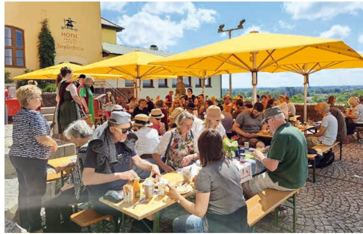
Rund 150 Besucher kamen im vergangenen Jahr zum Fairen Frühstück.

Die Fairtrade Stadt Dachau setzt mit diesem Frühstück ein Zeichen für mehr Handels- und Klimagerechtigkeit. Frühstücksprodukte mit dem Fairtrade-Siegel oder von Unser