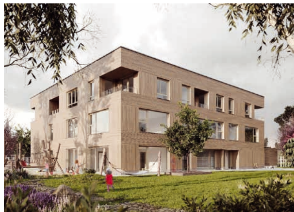
Sechs Kita-Gruppen sowie sechs Wohnungen kommen in dem neuen Gebäude an der Pollnstraße künftig unter (Modell).

Klimafreundlichkeit spielt – wie bei allen städtischen Neubauten – auch hier eine zentrale Rolle: Die Beheizung des Neubaus erfolgt über eine hocheffiziente Wärmepumpe, und eine zentrale Lüftungsanlage mit Wärmerückgewinnung sorgt für frische Luft. Im Sommer lassen sich die Räume über die Spielfläche im Atrium über Ventilatoren nachts kühlen. Das Flachdach ist zur Errichtung einer Photovoltaik-Anlage geeignet.