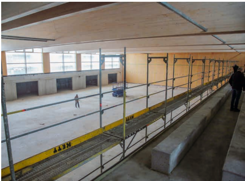
Bereits deutlich als großzügige Sporthalle zu erkennen – Baustellenrundgang im Rahmen des Richtfests Anfang März.

Bereits im vergangenen Jahr wurden mehrere Gebäudeteile abgebrochen, derzeit sind Klassenräume in einem Container-Provisorium untergebracht. Dieses Interimsgebäude ermöglicht die Errichtung des Erweiterungsbaus ohne wesentliche Störung des Schulbetriebs.