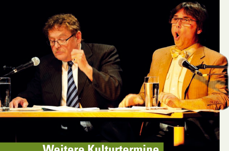
„Die letzten Tage der Menschheit“, 20. Juni, Simperl-Hof