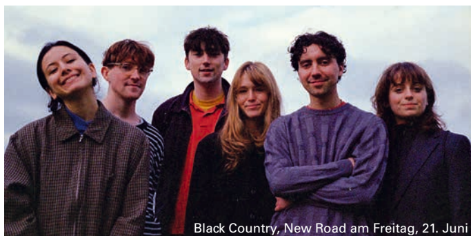
Black Country, New Road am Freitag, 21. Juni

Am Freitag, 21. Juni , gastieren Black Country, New Road auf dem Rathausplatz. Das Sextett, das Post-Rock mit Prog, Folk mit Punk und Jazz mit Synthesizern verbindet, wird derzeit gefeiert wie kaum eine andere britische Band. 25 € zzgl. VVK-Gebühr.