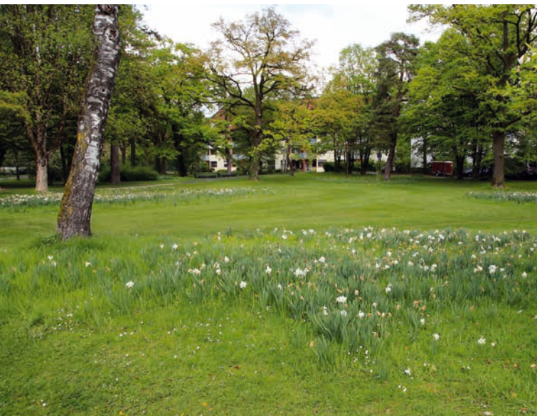
„Fit im Park“ am herrlichen grünen John-F-Kennedy-Platz.