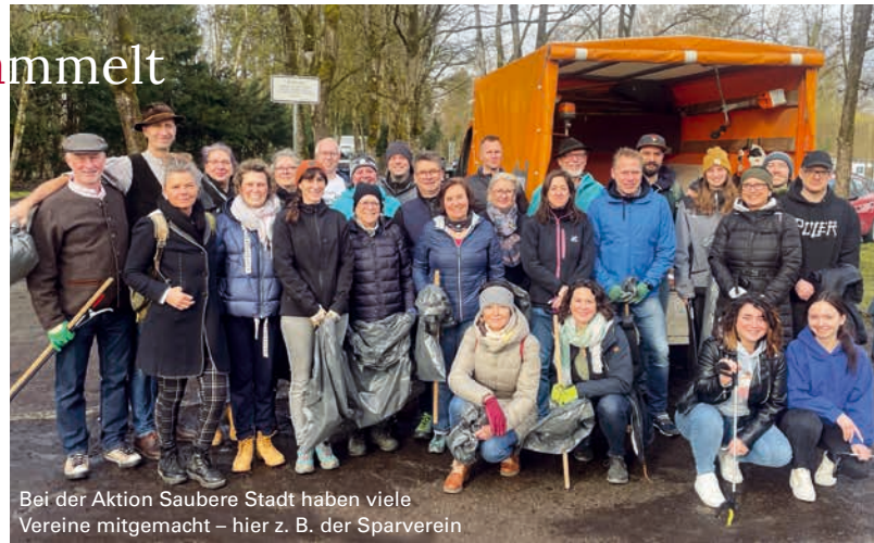
Bei der Aktion Saubere Stadt haben viele Vereine mitgemacht – hier z. B. der Sparverein

Im Frühling und Sommer hat „wilder Müll“ leider wieder Hochkonjunktur. Der ordnungswidrig entsorgte Abfall stört nicht nur unser Empfinden, sondern kann Mensch und Tier auch gefährlich sein. Bitte nutzen Sie daher für Ihre leeren Eis- und Kaffeebecher, benutzten Taschentücher und sonstigen Müll unbedingt die städtischen Abfalleimer. Rund 550 öffentliche Müllbehälter gibt es in ganz Dachau, also ganz gewiss auch einen in Ihrer Nähe – egal wo Sie gerade unterwegs sind. Sollte in ihm, trotz häufiger Leerung, mal kein Platz sein, entsorgen Sie Ihren Abfall doch bitte im nächsten Mülleimer oder ganz einfach zu Hause. ■