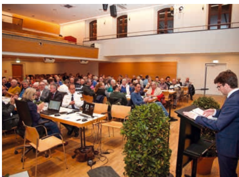
Volles Haus: Über hundert Bürgerinnen und Bürger haben sich im Ludwig-Thoma-Haus durch Oberbürgermeister Florian Hartmann umfassend informieren lassen.

Wie mehrfach berichtet, soll die in die Jahre gekommene Georg-Scherer-Halle durch einen Neubau ersetzt werden, und zwar an der Stelle der jetzigen städtischen Kunsteisbahn. Mit dem Abriss der Eisbahn würde ein beliebtes und günstiges Freizeitangebot sowie die Basis für den Eissportverein Dachau wegfallen. Ende März war die Kunsteisbahn nochmal Thema im Haupt- und Finanzausschuss des Stadtrats: Der Eissportverein hat angeboten, selbst eine Eisfläche zu errichten und zu betreiben, die Stadt Dachau wird das im Bebauungsplan für das ASV-Gelände vorgesehene Grundstück zur Verfügung stellen. ■