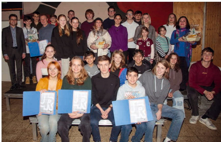
Glückliche Gewinner und Nominierte bei der Preisverleihung im Juz Ost.

Der 1. Preis – und damit 500 € – ging an das Dachauer Schülerinnenbüro. Dieses hat sich dafür eingesetzt, dass an allen weiterführenden Schulen im Landkreis in den Mädchentoiletten frei zugängliche Hygieneartikel zur Verfügung stehen. Damit leistete es einen Beitrag zur Enttabuisierung des Themas Menstruation. Den 2. Preis (300 €) erhielt die SMV des Josef-Effner-Gymnasiums, die sich mit einer Vielzahl von Aktionen für ein vielfältiges und buntes Schulleben einsetzt und zudem Sachspenden sowie 5.000 € für gemeinnützige Zwecke sammelte, unter anderem für die Dachauer Tafel und die Erdbebenhilfe. Mit dem 3. Preis (100 €) wurde die Mixed-Trainingsgruppe der